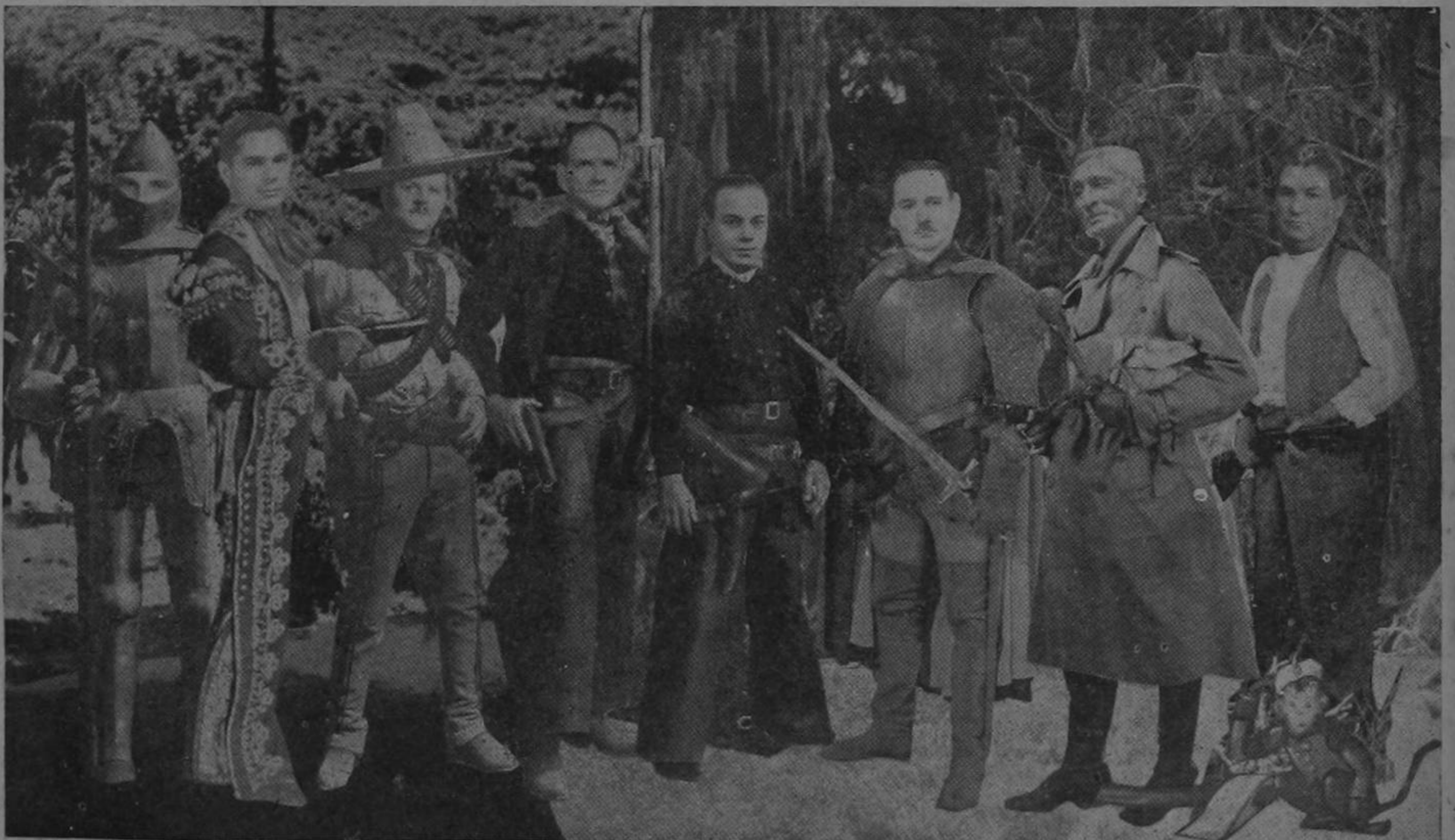
Gráfica de los señores Ministros en momentos en que conforme a las instrucciones del Presidente Ulate, se preparan para contestar cualquier ataque, interpelación, censura, agravio o burla a sus actos de funcionarios.