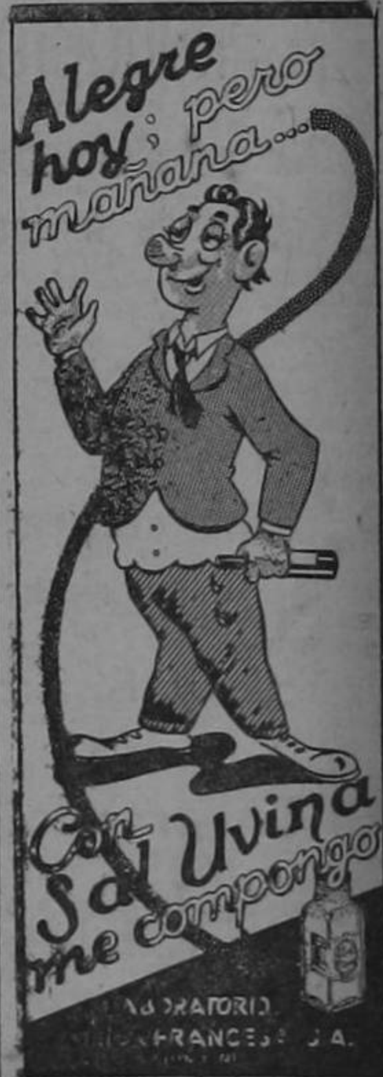
LABORATORIO FRANCES J.A.