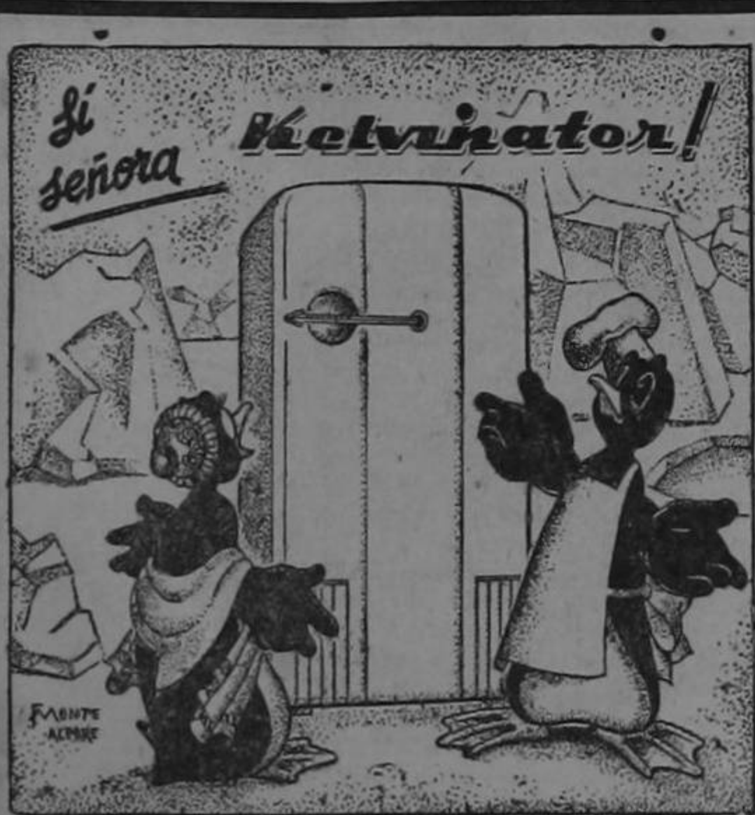
ALMACEN KOBURG SAN JOSE